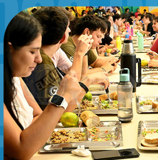
Beca de comedor