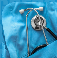
Beca de Salud