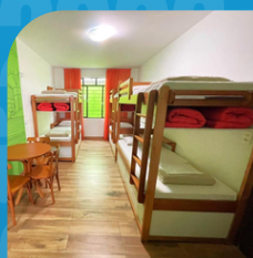
Beca de Albergue