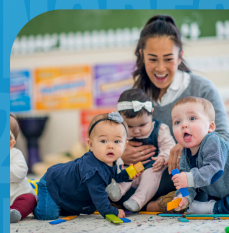
Beca de Cuidados